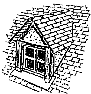
lucarne à deux pans dité jacobine. ou à cheval