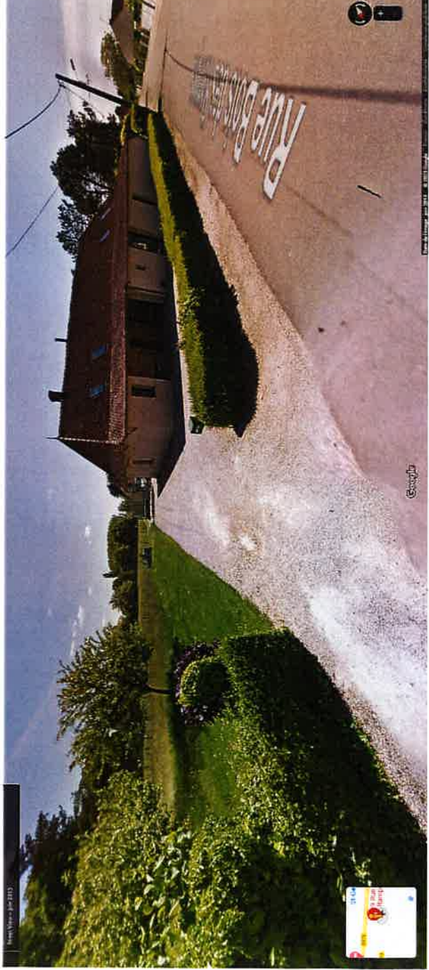
Vues depuis la Rue bois des Rampes, sur la haie non mitoyenne, définissant l'alignement de la voie (Rue bois des Rampes)